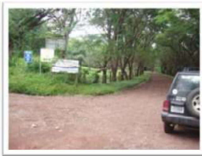
Cruce Playa Real - Puerto Viejo

Por la ruta a Tamarindo o Brasilito o Conchal, al llegar a Huacas , se sigue hacia el pueblo de Matapalo (rumbo a Playa Grande - Parque Baulas). En Matapalo, al final de la plaza de fútbol ("al topar con cerca"), se dobla a la derecha (rumbo a Playa Real ) y se siguen los rótulos azules de Pirate's Bay. Es recomendable ir preguntándole a la gente por Playa Minas (la gente local casi no usa el nombre Zapotillal). A unos 3.5 kilómetros de Matapalo, a mano derecha están las cabinas HOJA DEL BOSQUE. De ahí al cruce Playa Real - Puerto Viejo son aproximadamente 1.5 kilómetros.