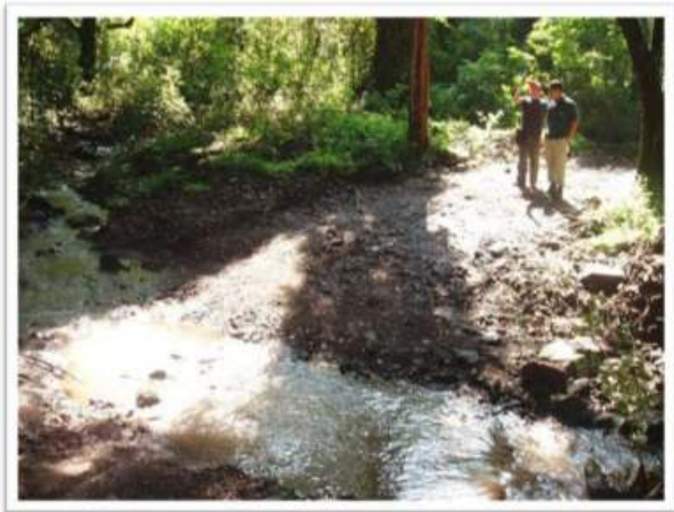
Quebrada estacional en el bosque costero de Nombre de Jesús durante una inspección de la Fiscalía. (05.10.2007)