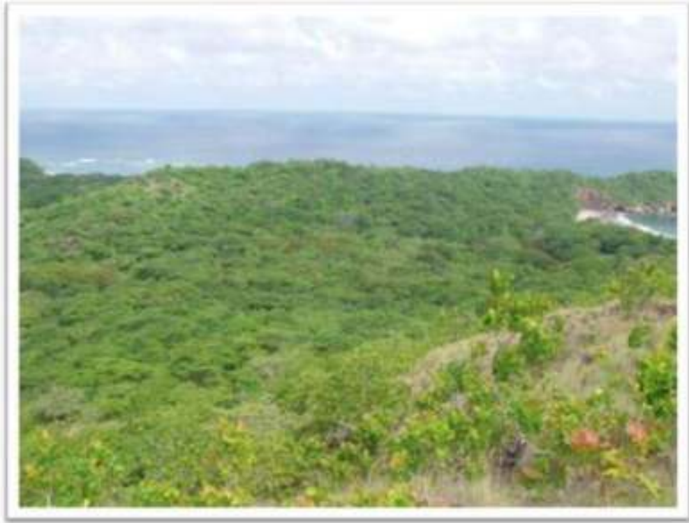
Segunda foto de la secuencia panorámica del bosque seco tropical costero de Nombre de Jesús y Zapotillal. (02.06.2007)