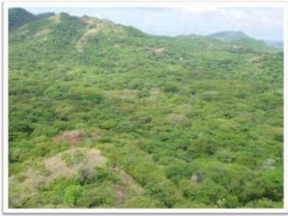
Cuarta foto de la secuencia panorámica del bosque seco tropical costero de Nombre de Jesús y Zapotillal. (02.06.2007)