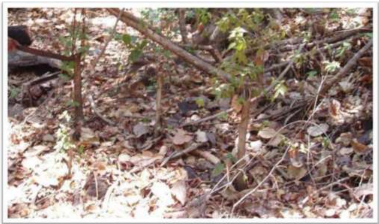
Árboles jóvenes rebrotan en el cauce seco de una quebrada estacional después de una socla en el sector de Zapotillal. (04.05.2006)