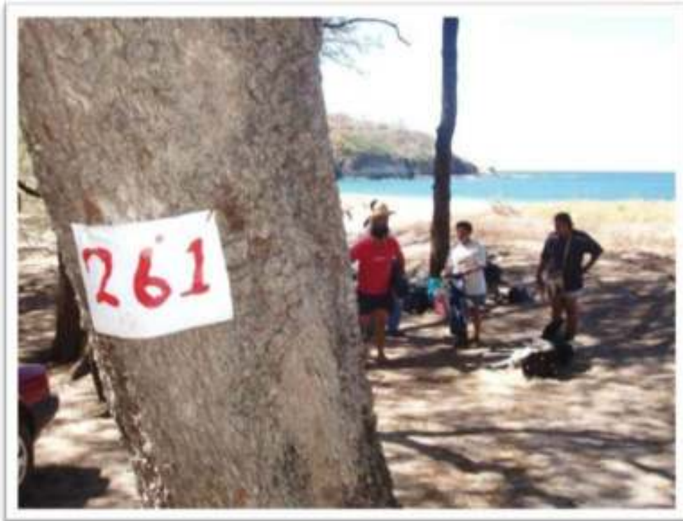
Árbol marcado por los técnicos del proyecto turístico residencial en playa Zapotillal. Al fondo, campistas guanacastecos. (30.01.2005)