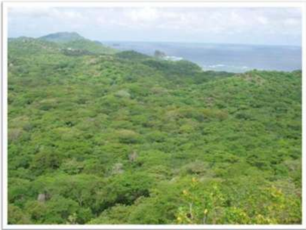
Tercera foto de la secuencia panorámica del bosque seco tropical costero de Nombre de Jesús y Zapotillal. (02.06.2007)