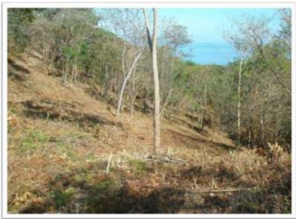
Colina socolada en el sector de Nombre de Jesús. (15.04.2008)