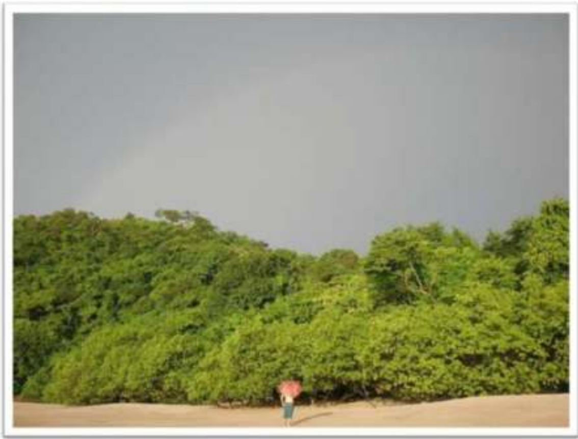
Pacto de la Alianza en el bosque de playa Zapotillal. (31.07.2008)