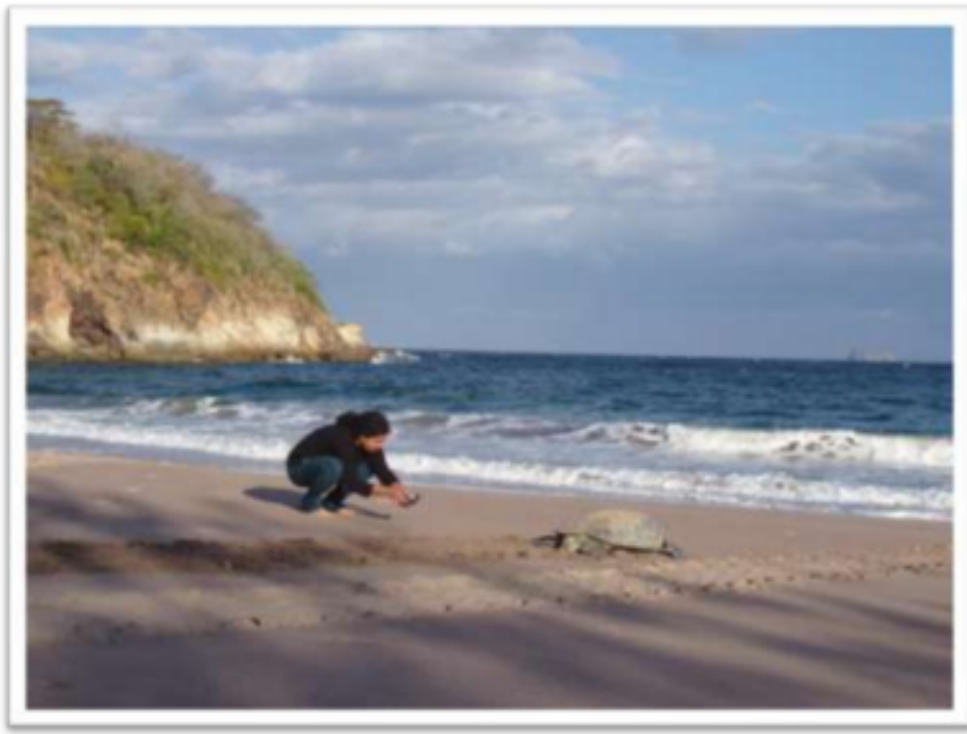
Tortuga negra ( Chelonia mydas agassizii ) retorna al mar después de desovar en playa Zapotillal. (02.01.2008)