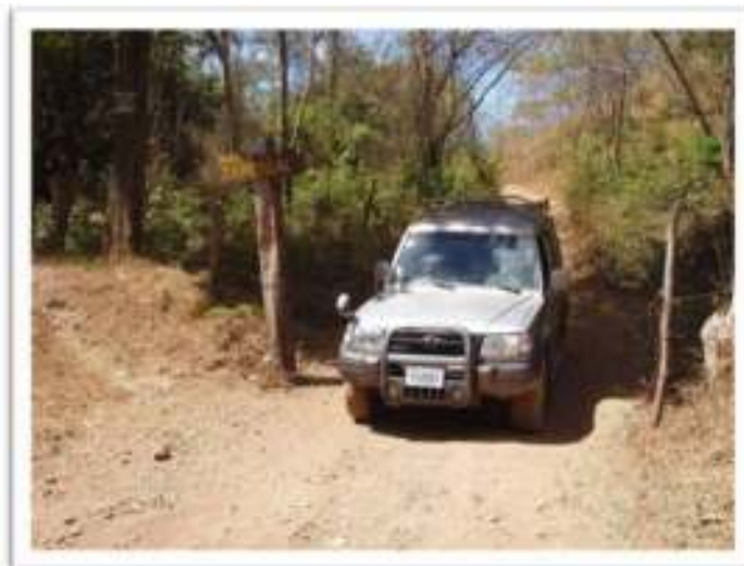
Entrada a playa Minas o Zapotillal

En el cruce Playa Real - Puerto Viejo se dobla hacia la izquierda (rumbo a Playa Real, siguiendo el rótulo azul de Pirate's Bay), aproximadamente a un kilómetro, se encuentra la entrada a Zapotillal.