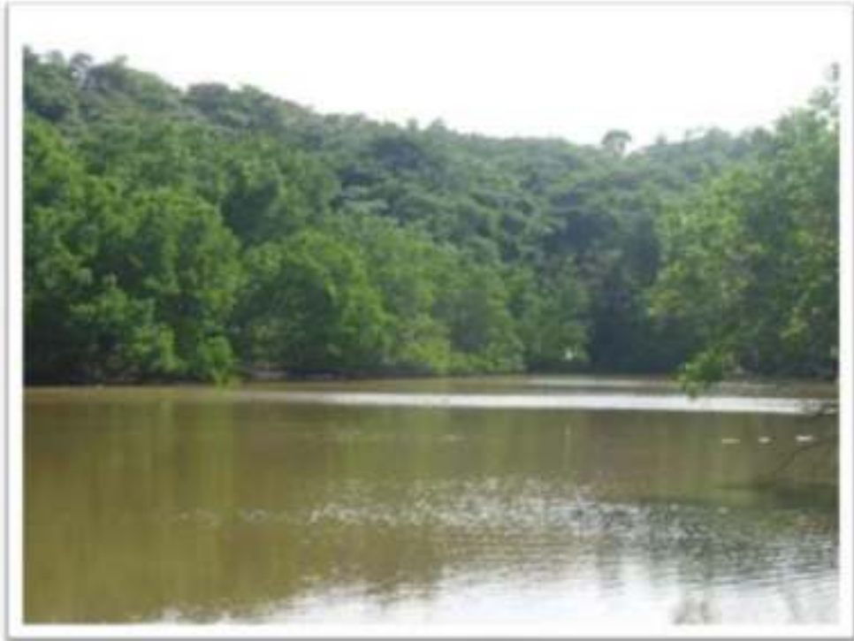
Laguna costera de Zapotillal durante la época lluviosa. (21.07.2007)