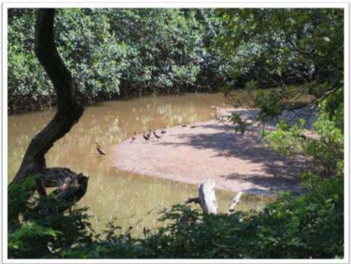
Patos piches ( Dendrocygna sp. ) rodeados de manglar en la laguna costera de Nombre de Jesús. (16.08.2008)