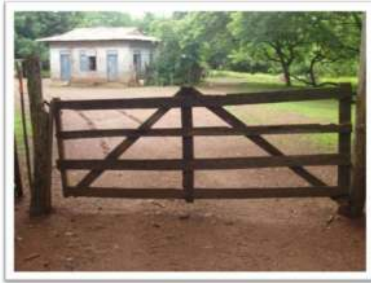
Entrada a Nombre de Jesús

El camino a Playa Minas o Zapotillal es público por ley. Se puede transitar libremente, sin restricciones, desde que logramos reabrirlo en 2008. Desde la entrada hasta la playa hay aproximadamente 700 metros. Preste mucha atención, actualmente ya no hay ningún rótulo de playa Zapotillal.