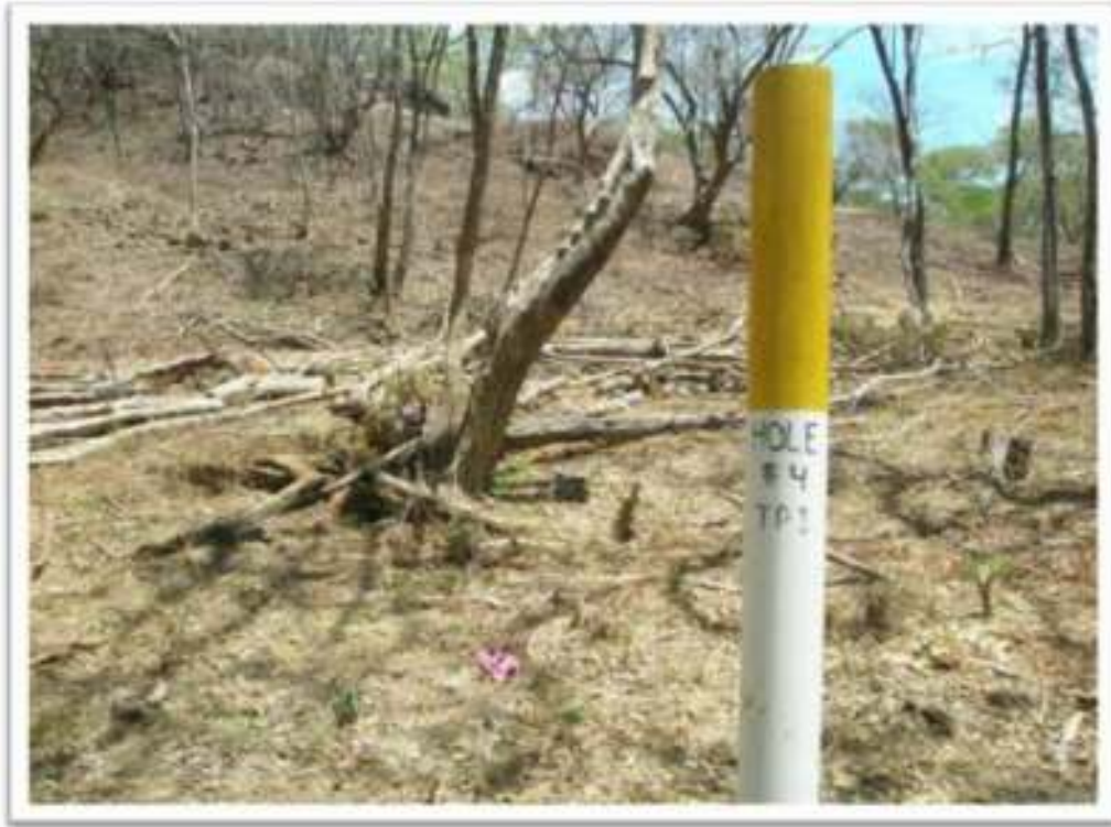
Marca del hoyo 4 del presunto campo de golf de 18 hoyos diseñado por Gary Player que se vende por Internet. (05.05.2008)